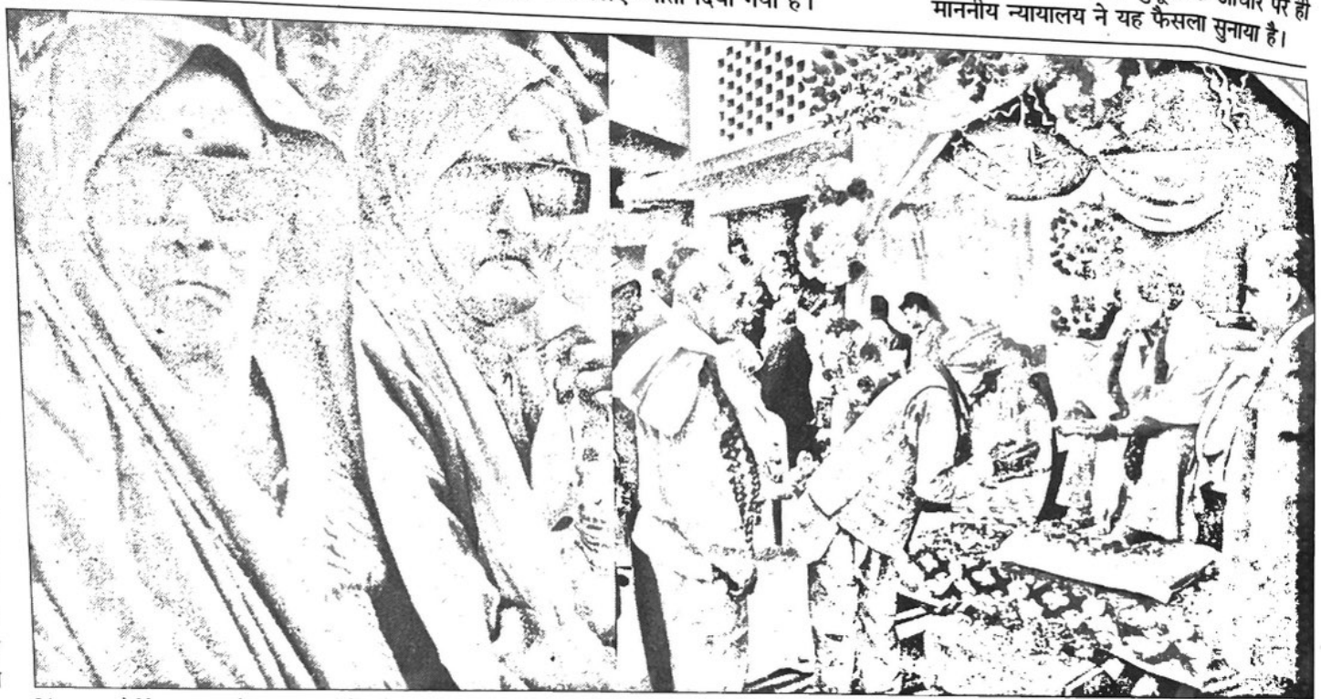
जिंद बाबा चैरीटेबल ट्रस्ट के शाहतलाई में लगे स्वास्थ्य शिविर में आए लोग।

। काग्रेस करने का होने वाले से मिलेगा। बिल के लिए गुणांक का अर्थ है तो क्रमशः को भूमि देश सरकार है। इसकी प्रभावितों को भाजपा प्रदेश में प्रस्तावित लिए नए भूमि चाहिए।